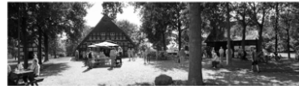
Backtag August 2018

Der Lilienhof in unserem Ortsteil Worphausen wurde in den Jahren 1983 bis 1991 als Bauernhofanlage aufgebaut. Träger dieses idyllischen Kleinods sind die Worphüser Heimatfrünn e.V., die diese Anlage in einer Vielzahl ehrenamtlicher Stunden aufgebaut haben, heute pflegen und unterhalten. Die Bauernhofanlage besteht aus einem Bauernhaus, einem Backhaus, einem Bienenstand, einem Schafstall, einer Scheune und einem Spieker. Der Lilienhof erhielt seinen Namen in Anlehnung der 1974 gebildeten neuen Gemeinde Lillienthal, zu der seitdem auch die ehemalige Gemeinde Worphausen gehört. Auf der historischen Bauernhofanlage des Lilienhofs finden Veranstaltungen statt, wie zweimal im Jahr der „Backtag“ mit frischem Butterkuchen aus dem hofeigenen Backofen und musikalischer Unterhaltung auf dem Hof, Lesungen bei Kaffee und Kuchen, Pizzabacken für alle, ein plattdeutscher Gottesdienst zum Erntedank, ein Laternenumzug für die Kleinen, ein plattdeutsches Theater sowie eine „Textilwerkstatt“ und noch einiges mehr. Ebenfalls besteht die Möglichkeit sich auf dem Lilienhof standesamtlich trauen zu lassen.