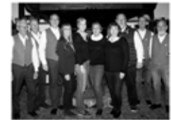
Unser aktueller Vorstand