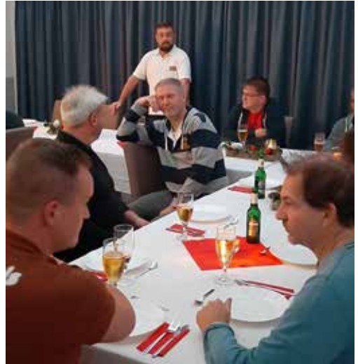
Dankesworte von der Chefabteilung